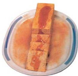
Biscuit de higos.

En cuanto al vino, se consume el de la tierra, de pitarra , elaborado artesanalmente.