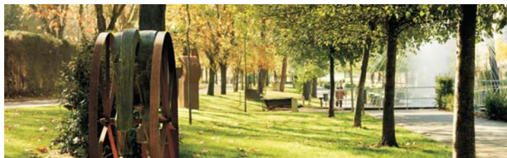
Parque del Príncipe. Cáceres

Información de horarios y precios de visitas a las torres de la ciudad monumental de Cáceres.