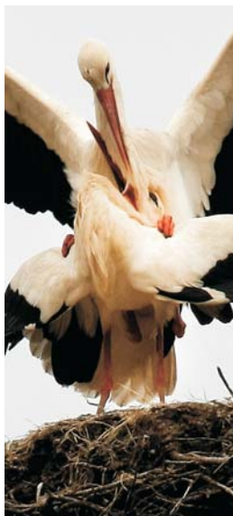
Cigüeñas. Autor: J. Gallego