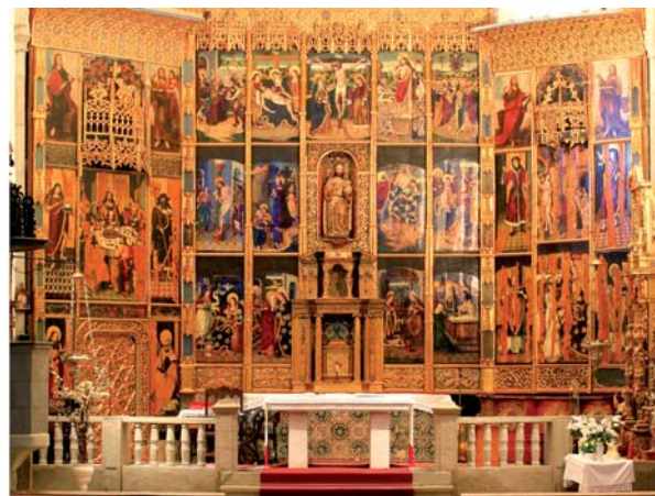
Retablo, Calzadilla de los Barros

from the livestock-breeding and pastureland sector acting as guides. Transfer to the "Quinta del Triario", a Roman Villa situated in the neighbouring village of Don Álvaro, Roman meal, time to rest, relaxing foot massage on a "triclinium". Roman dinner.