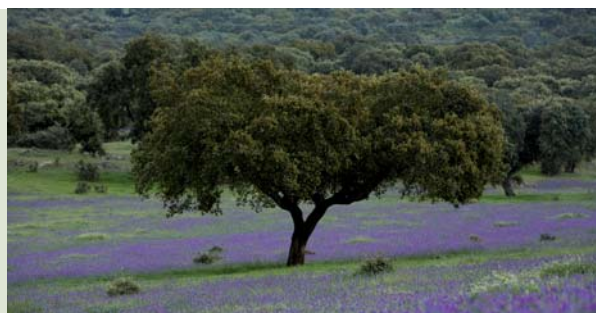
Parque Natural de Cornalvo

Desayuno y salida hacia Bodegas "Viña Santa Marina". Visita a las bodegas y viñedos. Encuentro con los soldados romanos en las instalaciones de la bodega y breve charla sobre los vinos aromatizados que se tomaban en la "Emérita Augusta" y en todo el Imperio Romano. Visita a Mérida, capital de la Lusitania. Salida hacia el Centro de ocio "El Molinero", almuerzo típico extremeño. Visita a la finca "La dehesa" en las inmediaciones del Parque Natural del