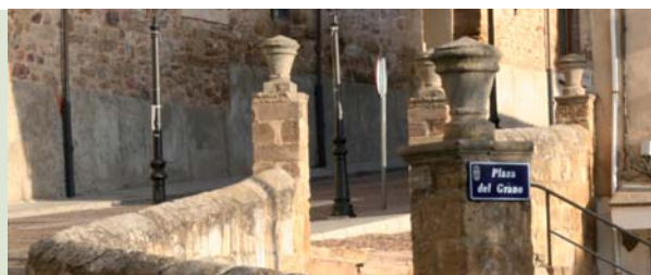
Plaza del Grano, Benavente

León: "Tapeo" por el Barrio Húmedo, Catedral de Sta. María, Basílica de San Isidoro.