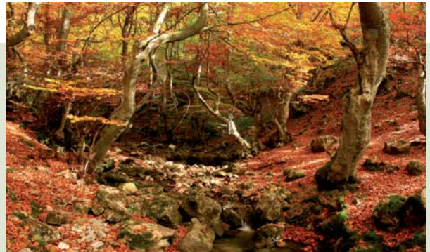
Hayedo de Ciñera, La Pola de Gordón

Desayuno y regreso al Aeropuerto de Asturias para embarcar rumbo al lugar de origen.