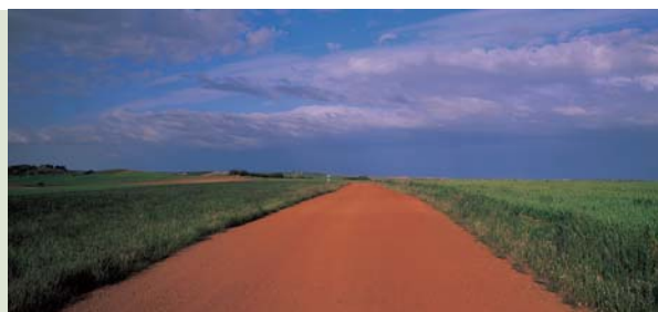
Provincia de Sevilla

El Hotel Vincci La Rábida está diseñado a partir de una casa palacio del siglo XVIII, ubicada en el centro de la ciudad, a unos pasos de la catedral sevillana y de la Plaza de Toros, "La Maestranza". Cuenta con un luminoso y acogedor patio interior, en el que podrá disfrutar de momentos de tranquilidad en un entorno incomparable. El Hotel está bien comunicado con las vías principales de acceso y se encuentra a un corto paseo de la zona comercial de la ciudad y de diversos puntos de interés. El hotel está enmarcado en el Barrio del Arenal, bien conocido por sus restaurantes, en los que se ofrecen las famosas "tapas" de Sevilla. El hotel Vincci La Rábida es conocido también por ser punto de encuentro de los toreros, por su exquisita gastronomía y atención personalizada.