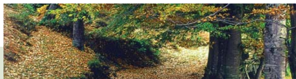
La Güeria, Mieres

Palacio Renacentista del Siglo XV. En el centro histórico de la capital zamorana, se alza este hotel palacio construido sobre una antigua alcazaba romana a mediados del siglo XV y ofrece al viajero la oportunidad de descubrir toda la belleza del entorno natural, monumental y artístico de la tierra zamorana. El aroma medieval del interior, que se aprecia en armaduras, tapices nobiliarios y atractivas camas con dosel, se combina con el estilo renacentista de su patio, galería acristalada de madera y escudos heráldicos.