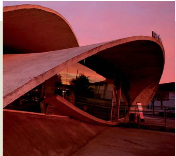
Estación de autobuses, Casar de Cáceres

Palacio del siglo XIV. El antiguo Palacio de Torreorgaz, levantado sobre cimientos árabes, se presenta con puerta de dintel y escudo barroco en el corazón del casco histórico artístico de Cáceres, ciudad declarada Patrimonio de la Humanidad. Fundado por Diego García de Ulloa, caballero de la Orden de Santiago, el Hotel, construcción del Siglo XIV, está presidido por su esbelta torre. Gótico, Renacimiento y Barroco son estilos personalizados en el edificio y en su entorno monumental.