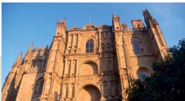
Catedral nueva, Plasencia

Y si quieres un recorrido de Lujo por la Ruta de la Plata te ofrecemos nuestra mejor propuesta, una creación de L&P Travel Selección alojándote en las Habitaciones Únicas de Paradores Nacionales , lujo y exclusividad con un trato especial.