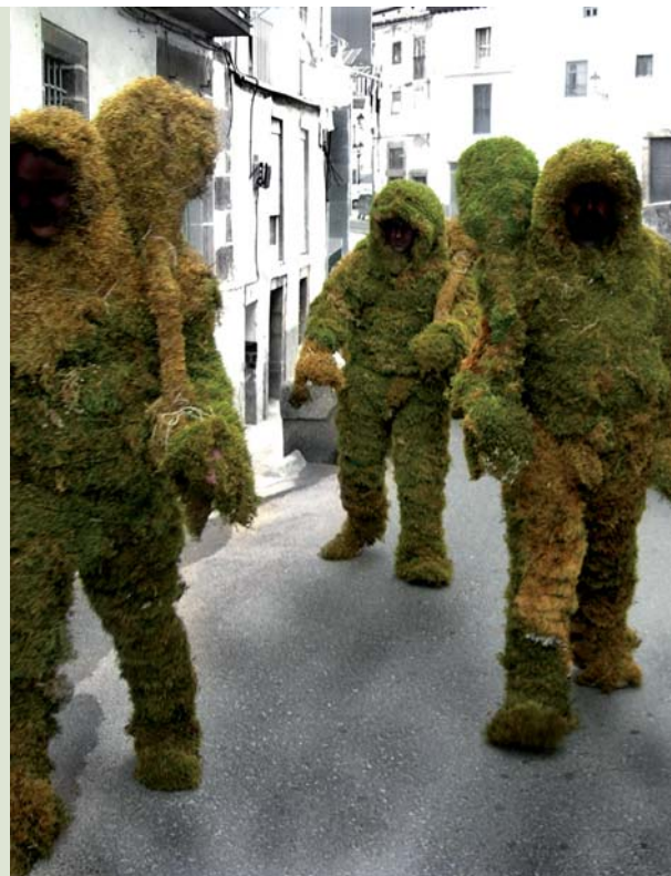
Hombres de musgo, Béjar

Desayuno y salida hacia el lugar de origen. Almuerzo en ruta no incluido.