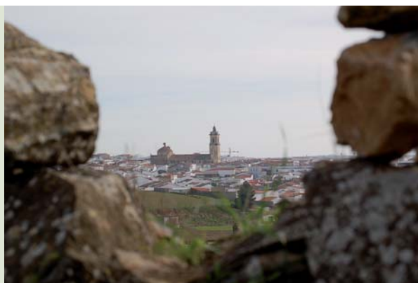
Vista general, Fuente de Cantos