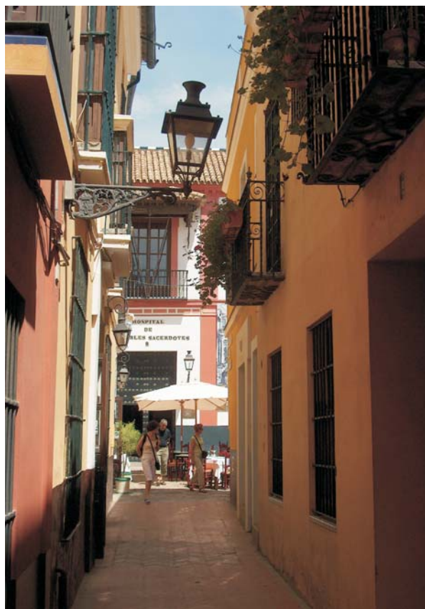
Barrio de Santa Cruz, Sevilla