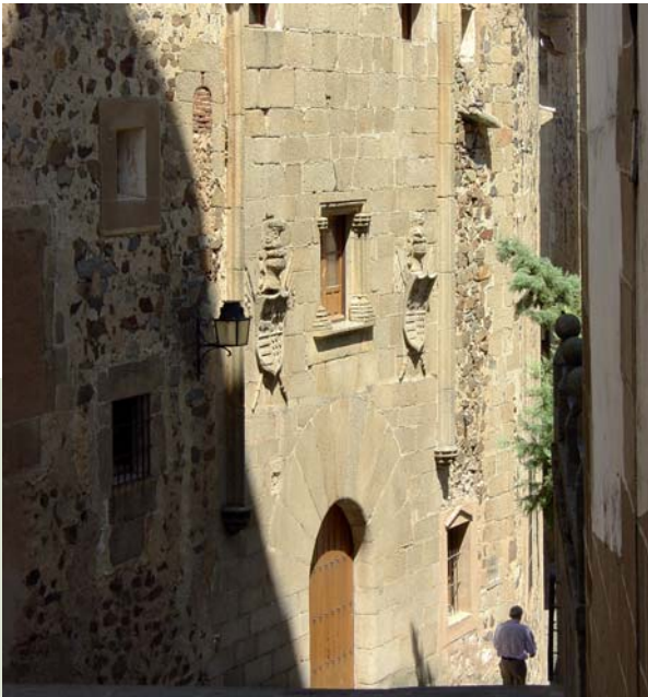
Casa de los Becerra, Cáceres

Desayuno. En la mañana salida hacia Castilla-León. Llegada a Salamanca por cuenta del cliente y alojamiento en el Hotel Oasis Horus Salamanca**** en Santa Marta de Tormes.