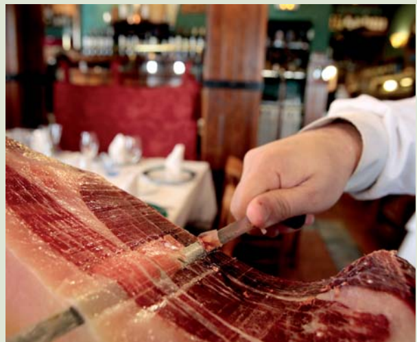
Jamón de Guijuelo, Salamanca

Breakfast. We recommend a visit to the city of Salamanca in the morning before setting off on the return journey home.