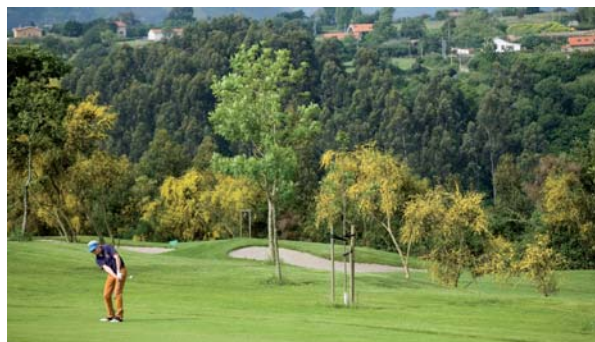
Campo Municipal de Golf La Llorea, Gijón

Desayuno. En la mañana recomendamos una visita a la ciudad de Salamanca antes de emprender el camino de regreso al punto de origen.