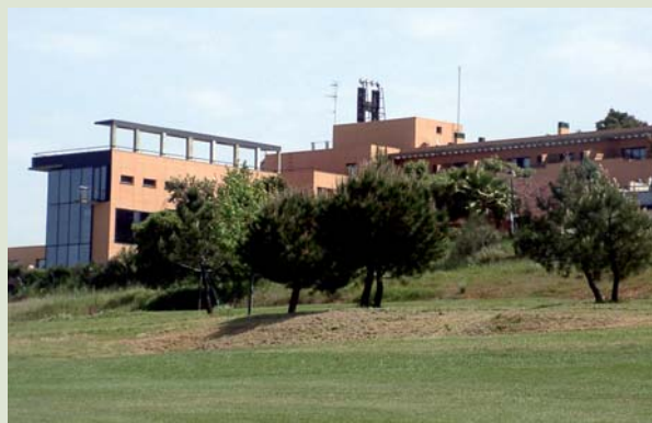
Norba Club de Golf, Cáceres

Cities included in the deal: Salamanca, Cáceres, Mérida and Seville.