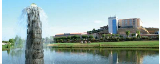
Golf Villamayor, Salamanca

Desayuno. En la mañana recomendamos una visita a la ciudad de Salamanca antes de emprender el camino de regreso al punto de origen.