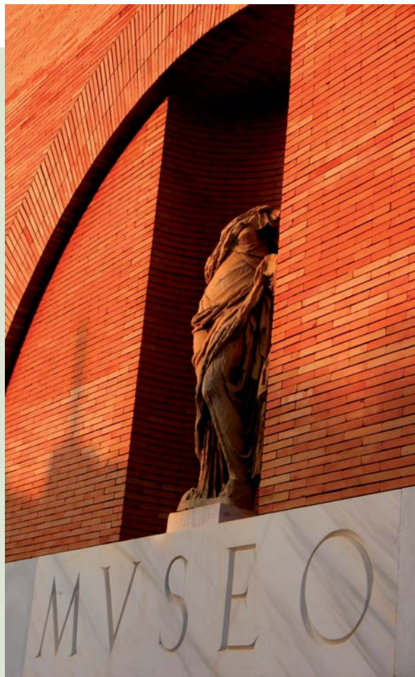
Museo Nacional de Arte Romano, Mérida

Ciudades Incluidas en la Promoción: Salamanca, Cáceres, Mérida y Sevilla.