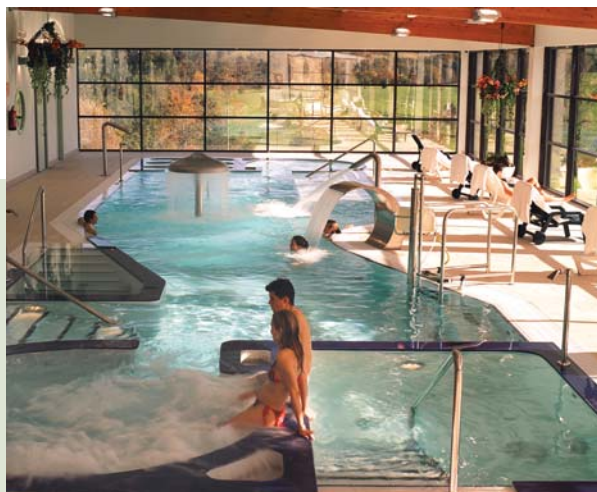
Balneario La Llorea, Gijón

Desayuno. Día dedicado a la práctica del golf en el Campo de la Llorea de 18 hoyos, situado al lado del hotel, con un recorrido rodeado de robles, castaños y avellanos bordeando los límites del campo.